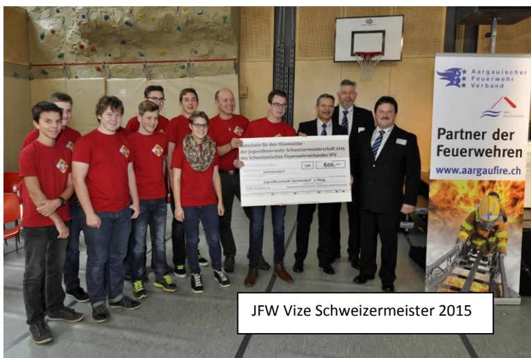
JFW Vize Schweizermeister 2015