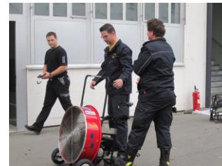
Foto vom Lüfterkurs 2014