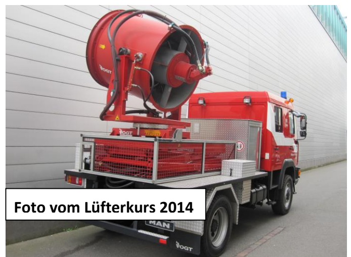
Foto vom Lüfterkurs 2014